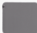
HP 100 rengøringsvenlig musemåtte 8X594AA