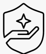
3 års afhentning og returnering UM963E