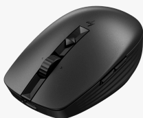
HP 710 Rechargeable Silent Mouse 6E6F2AA